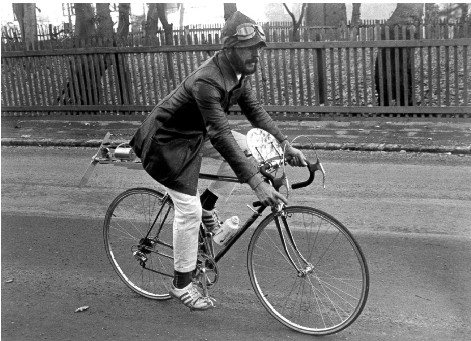
Hermann Härtel Zihaloides Sparkraftrad, Puch Vent Noir II mit 14,92 cm 3 Viertaktmotor