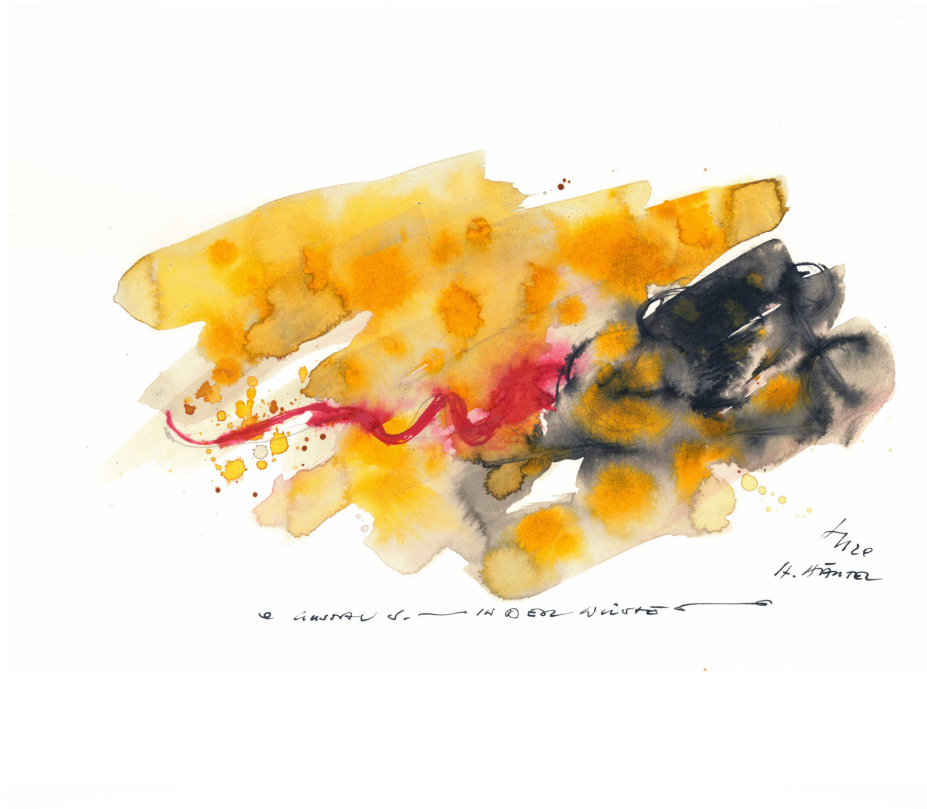
Hermann Härtel Gustav S. – in der Wüste, 2020 Mischtechnik auf Papier