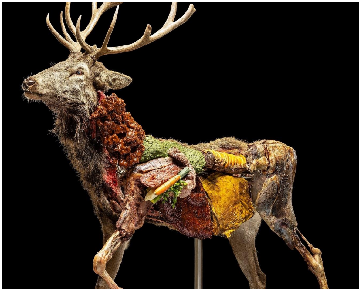
Johannes Rass, Animal on Stage / Cervus Elaphus , 2023 Mixed Media, Performance, Fotografie, 200 x 180 cm (Detail)

Kuratorische Assistenz: Melanie Brandstetter