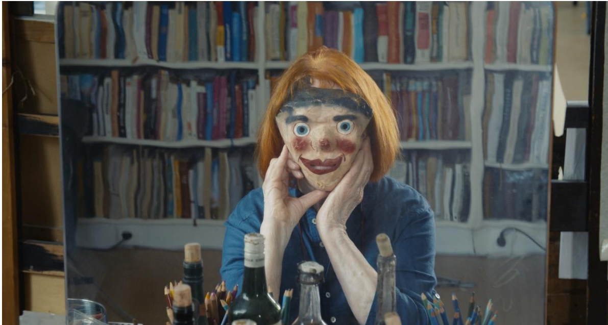
Christiana Perschon/Bildrecht, Wenn ich mich zeichne, existiere ich dreifach , 2023, Filmstill Im Rahmen der Ausstellung AUF DEN SCHULTERN VON RIESINNEN – ab 9. März 2024