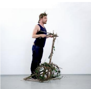
Peter Moosgaard, Upward Mobility, 2015

Fliegende Autos, sprechende Roboter und Turnschuhe, die sich selbst zubinden: Science-Fiction Geschichten sind voll von wundersamen Fahrzeugen und Maschinen. Welche Geräte würden die SchülerInnen erfinden? Welche Maschinen würden ihnen den Alltag erleichtern? Die Teilnehmer entwerfen ihre visionären Geräte und bauen einen Prototyp aus verschiedenen Materialien (Holz, Pappe, Draht etc.). Inspiration liefern uns die Arbeiten von Peter Moosgaard in der Ausstellung.