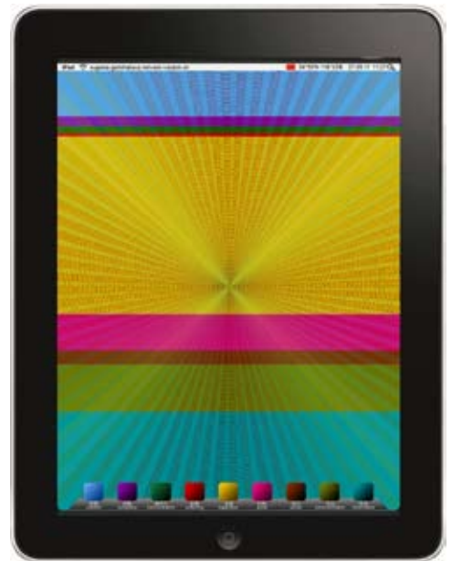
Eugenia Gortchakova, Internet Happiness, 2011, C-Print auf Papier unter Plexiglas, 50x120 cm, © Eugenia Gortchakova

Bildmaterial zum Download auf: www.k-haus.at/de/presse/aktuell