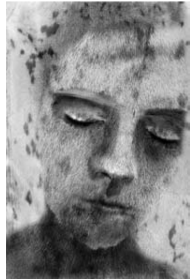
Magdalena Duda-Patraszewska, Futro 2, 2011, digital print, 100x150 cm, © SMTG Krakó