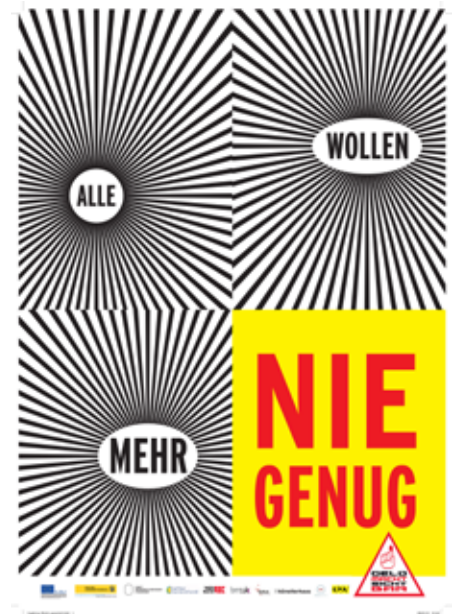
Ingeborg Strobl, "Geld macht sichtbar", 2013, Plakat, 238x168 cm © Ingeborg Strobl