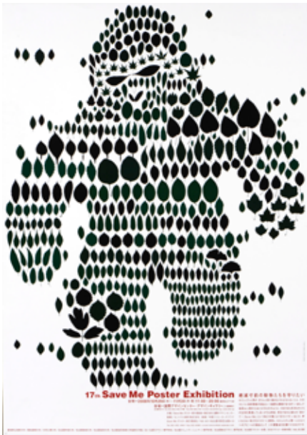
Shunji Nii Nomi, 17th save me poster exhibition, 2008, Offset