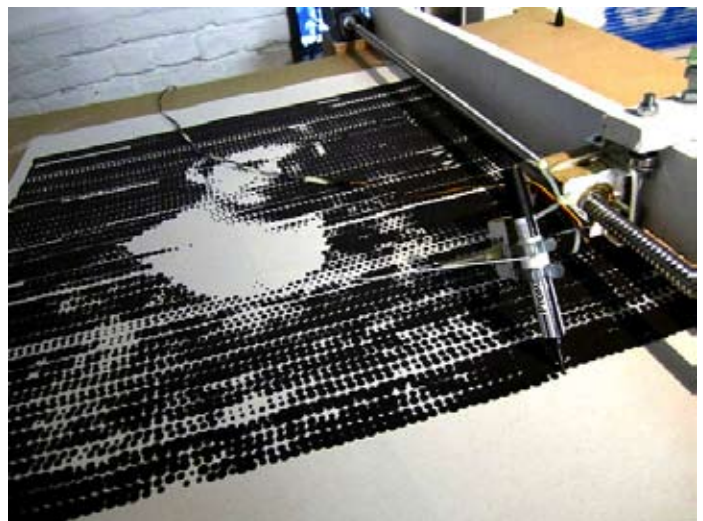
Paul Ferragut, Time Printing Machine, 2011 © Paul Ferragut