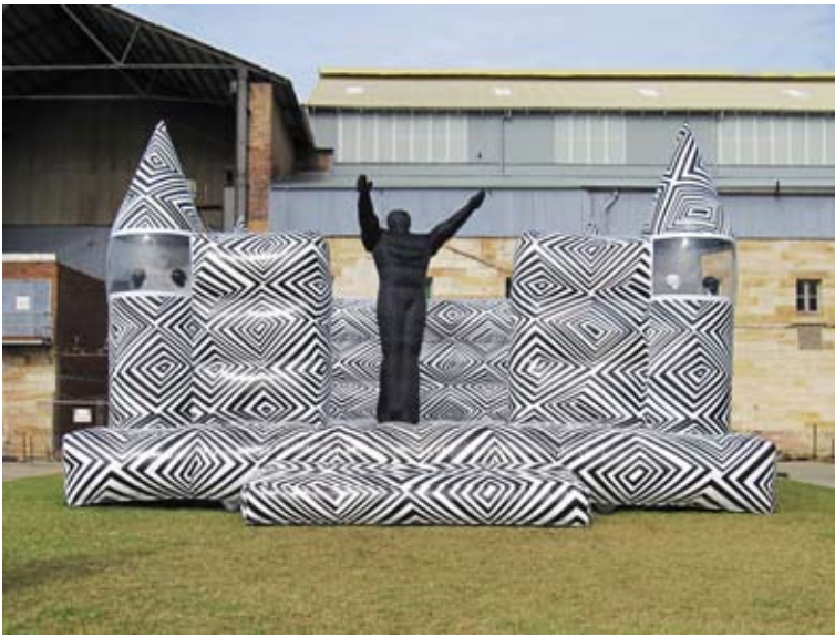
Brook Andrew, Jumping Castle War Memorial, 2010, softsculpture, 7x7x4 m © Brook Andrew